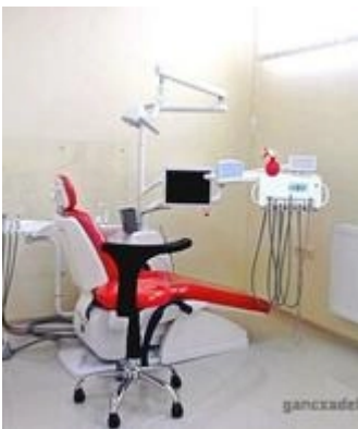
ნ. ბარათაშვილის #10