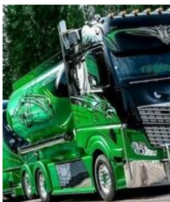
Kościerzyna 83-400 Polska